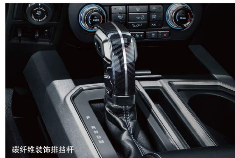
碳纤维装饰排挡杆