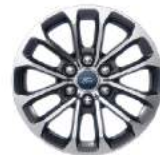
17寸锻造铝合金轮毂