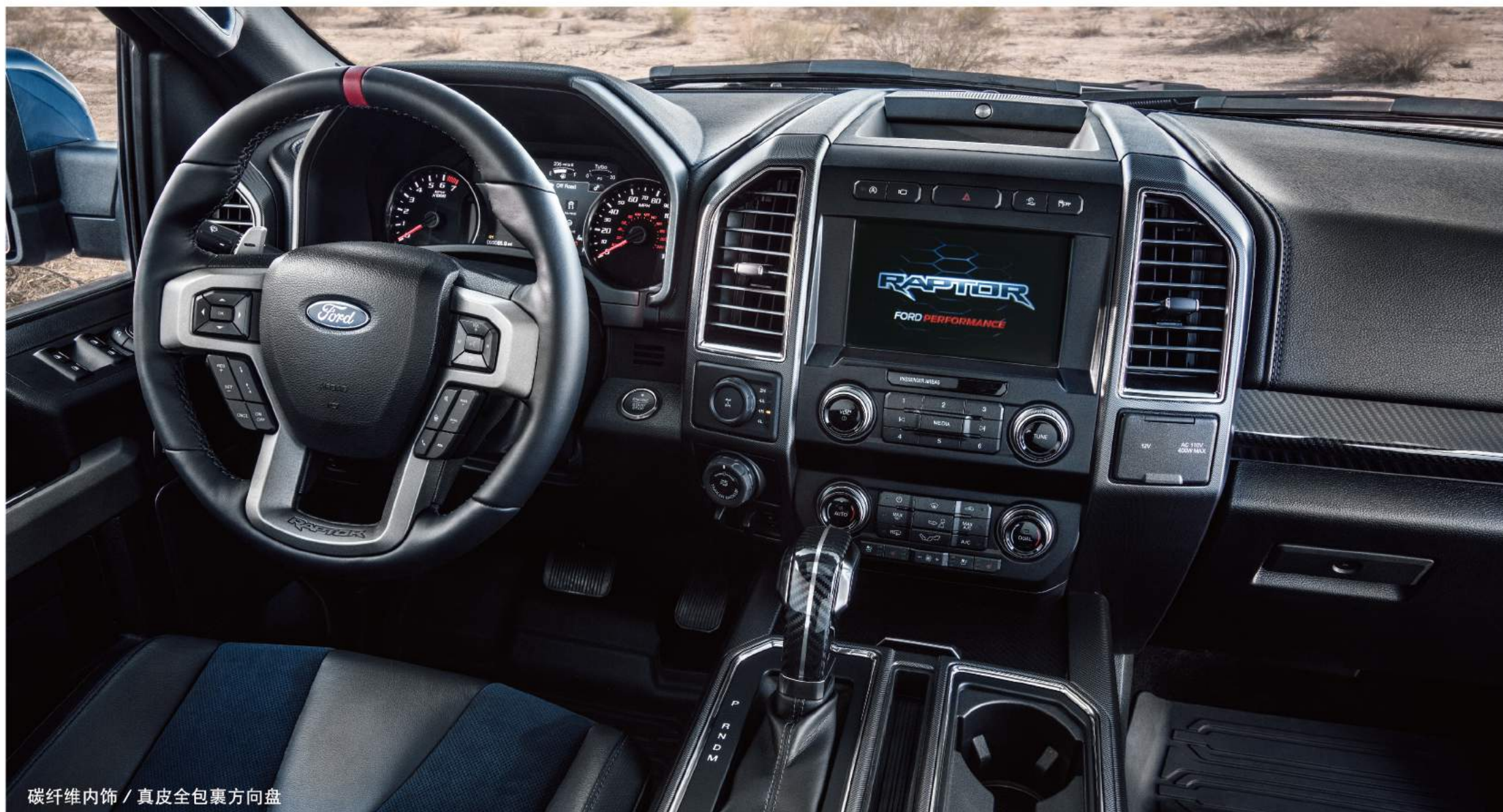
碳纤维内饰 / 真皮全包裹方向盘