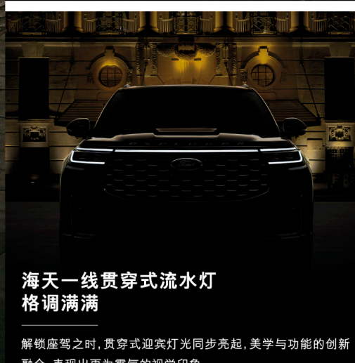
海天一线贯穿式流水灯 格调满满

超5米长*超2米宽*近1.8米高超大车身,如激流勇进的视觉冲击,惊艳还原豪华游艇的设计灵感。