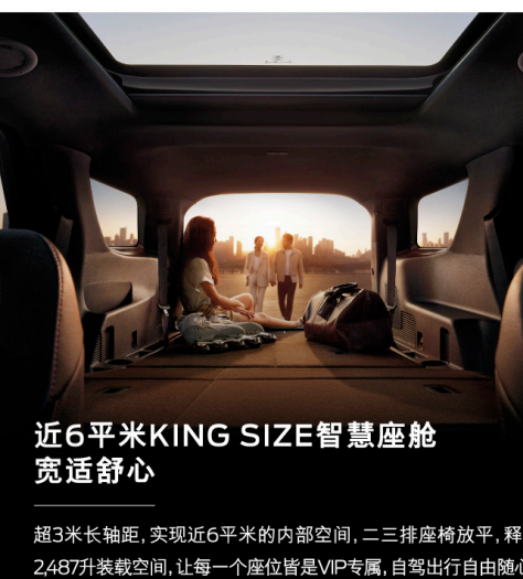
近6平米KING SIZE智慧座舱 宽适舒心

超3米长轴距,实现近6平米的内部空间,二三排座椅放平,释放2.487升装载空间,让每一个座位皆是VIP专属,自驾出行自由随心。