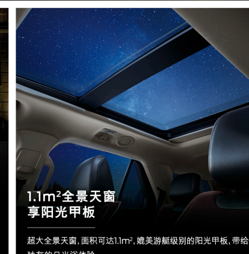
1.1m²全景天窗 享阳光甲板

解锁座驾之时,贯穿式迎宾灯光同步亮起,美学与功能的创新融合,表现更为霸气的视觉印象。