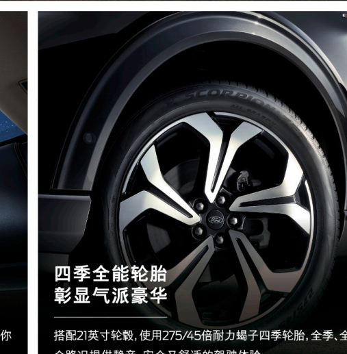
四季全能轮胎 彰显气派豪华

超大全景天窗,面积可达1.1m²,媲美游艇级别的阳光甲板,带给你独有的日光浴体验。