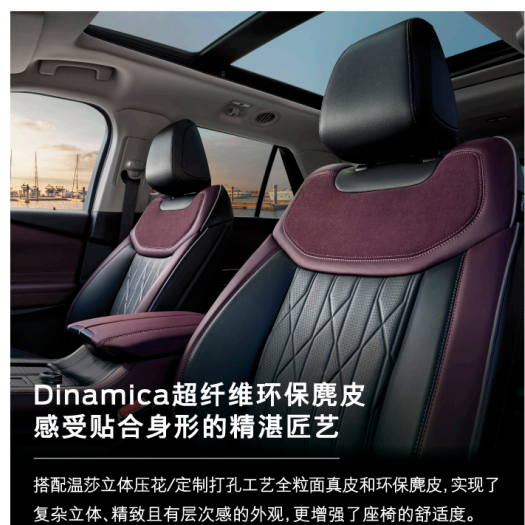
Dinamica超纤维环保皮革 感受贴合身形的精湛工艺

全系标配12.3英寸全彩数字液晶仪表盘及27英寸中控,4,032*756高分辨率实现真4K效果,打造私享IMAX巨幕观感。