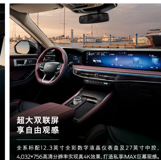
超大双联屏 享自由观感

超3米长轴距,实现近6平米的内部空间,二三排座椅放平,释放2.487升装载空间,让每一个座位皆是VIP专属,自驾出行自由随心。