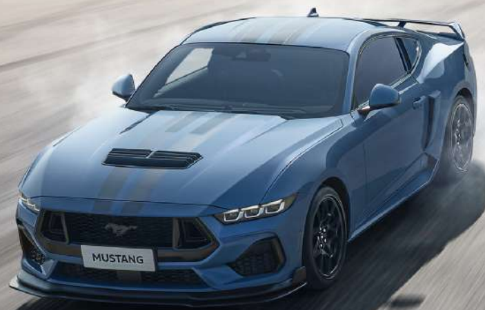
全新 Mustang® 硬顶性能跑车