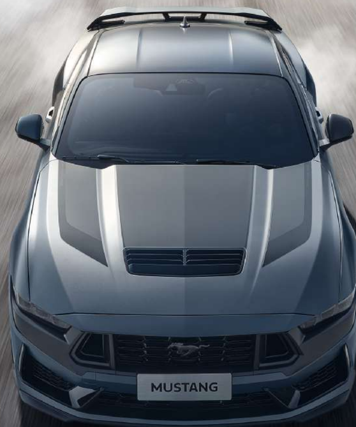
全新 Mustang Dark Horse® 5.0L V8 高性能跑车