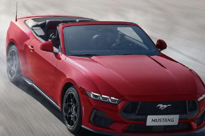
全新 Mustang® 敞篷运动跑车