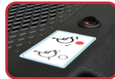
貼心設計的止動開關：