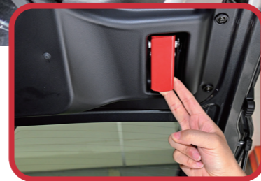
車內後尾門逃生開關