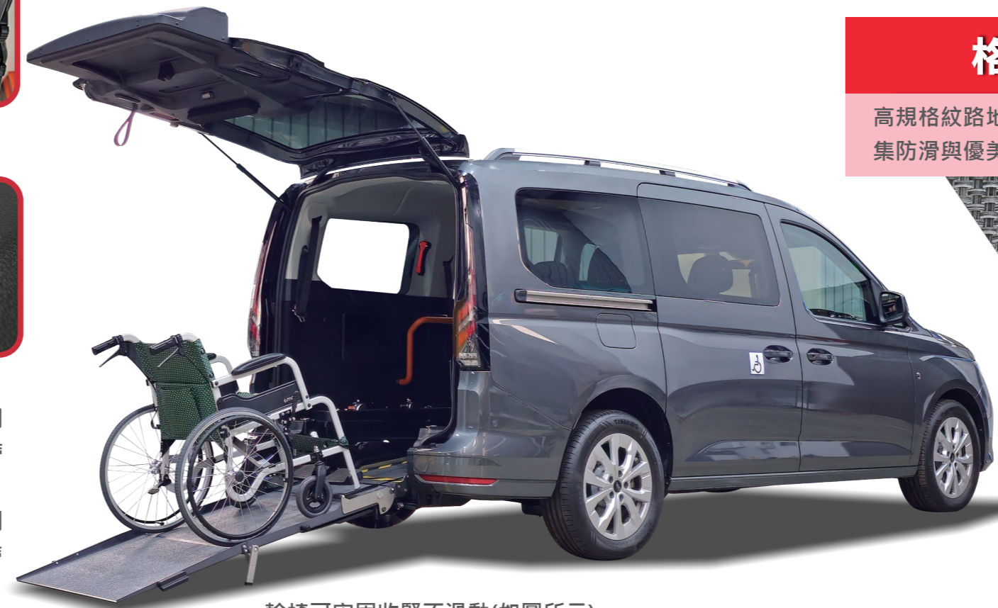
輪椅可牢固收緊不滑動(如圖所示)

義大利設計美學維持後保桿的外觀設計與原車無違和，就像是原裝出廠的車輛，上下車時更感尊榮