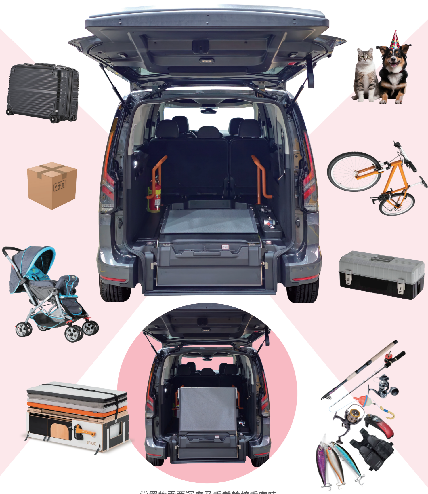
當置物需要深度及乘載輪椅乘客時 斜坡立於車尾後方