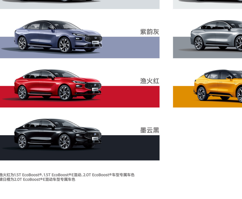
*渔火红为1.5T EcoBoost®, 1.5T EcoBoost®E混动, 2.0T EcoBoost®车型专属车色 *曜日橙为2.0T EcoBoost®E混动车型专属车色