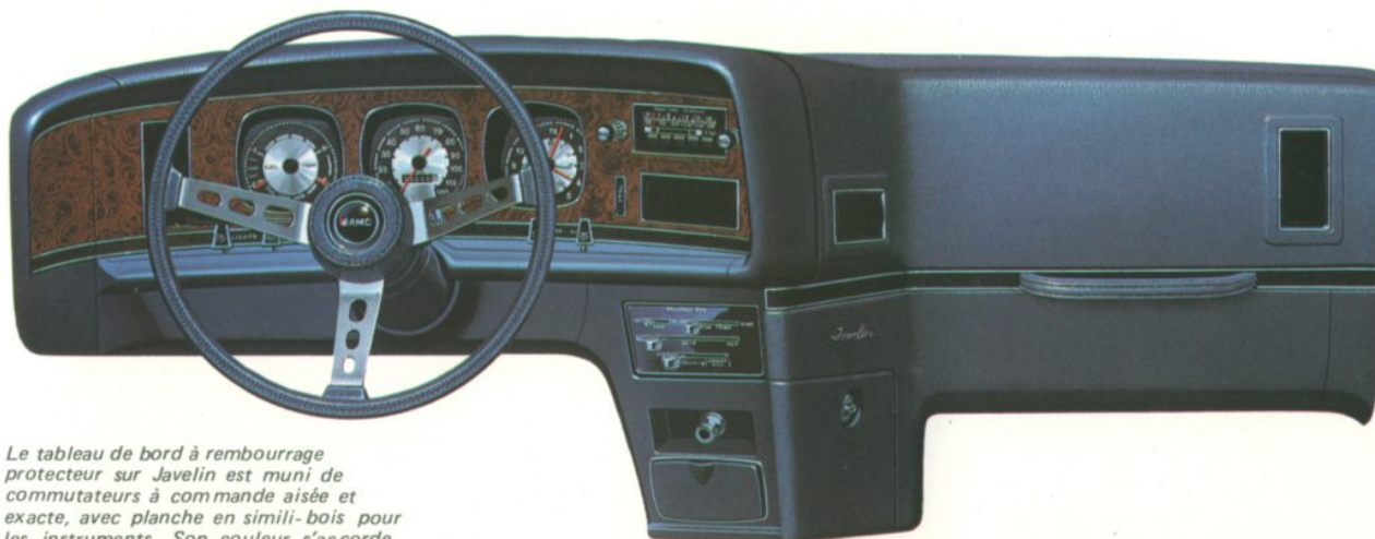
Le tableau de bord à rembourrage protecteur sur Javelin est muni de commutateurs à commande aisée et exacte, avec planche en simili-bois pour les instruments. Son couleur s'accorde avec l'intérieur et se marie bien avec chaque option choisie.