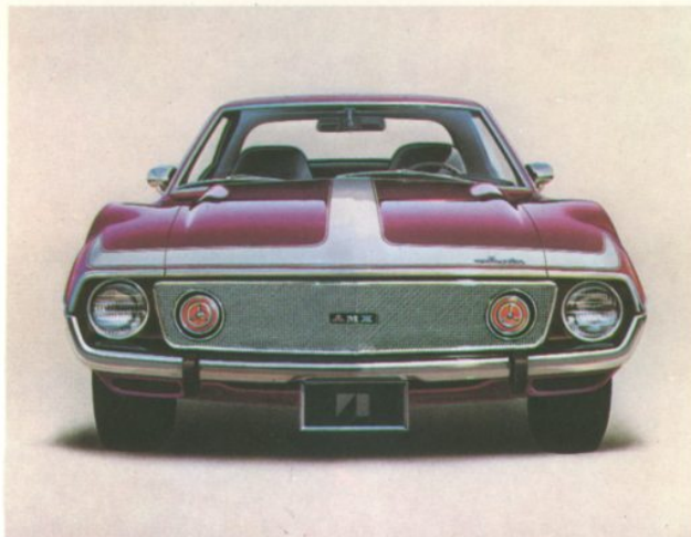
AMX en prune métallisée

Javelin et AMX — Les expériences faites en course et en compétition en font les meilleures dans leur classe. Essayez-les!